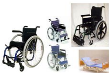
福祉用具の選定と適合